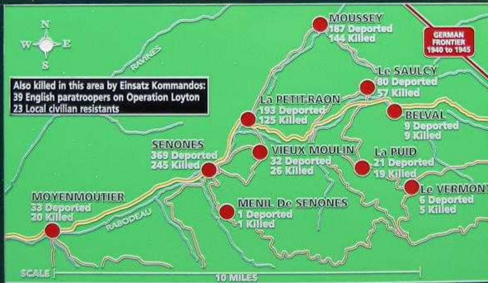
La plaque du Phantom Memorial

The historical context together with the geographical location of these village helps to explain why these villages were singled out and received such brutal treatment.