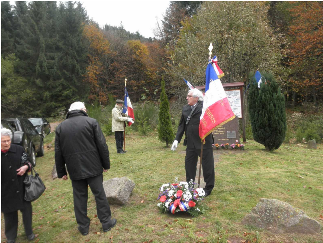
Depuis la Toussaint 2012