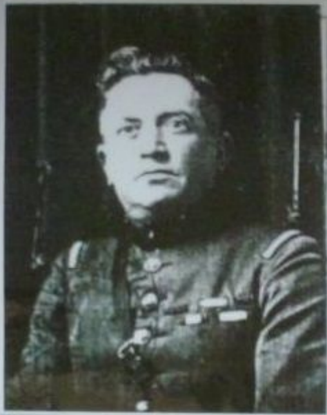
Garde Forestier Saint Benoit la Chipotte (Vosges)