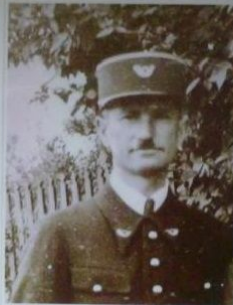
Brigadier Forestier La Salle (Vosges)

Né le 14 février 1902 à Chassey les Montbozon (Haute-Saône)